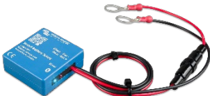
Bluetooth sensing: Smart Battery Sense