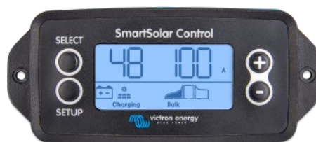
SmartSolar pluggable display

Simply remove the rubber seal that protects the plug on the front of the controller, and plug-in the display.