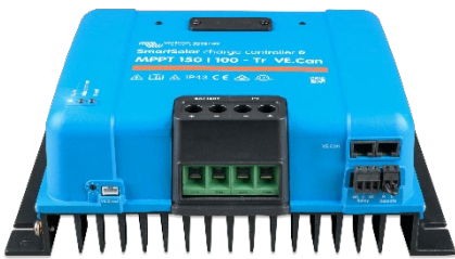
SmartSolar Charge Controller MPPT 150/100-Tr VE.Can without display