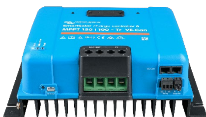
Regolatori di carica SmartSolar MPPT 150/100-Tr VE.Can senza display