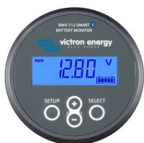
Rilevamento Bluetooth: Dispositivo di controllo della batteria Smart BMV-712