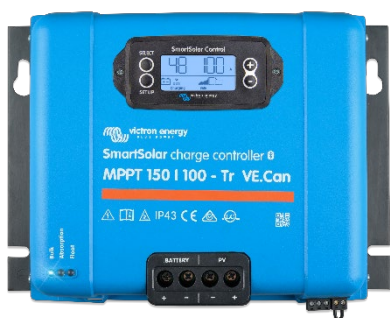
Regolatori di carica SmartSolar MPPT 150/100-Tr VE.Can con display a spina opzionale