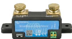
Bluetooth sensing: SmartShunt