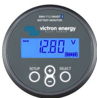
Bluetooth sensing: BMV-712 Smart Battery Monitor