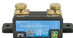
Rilevamento Bluetooth: SmartShunt