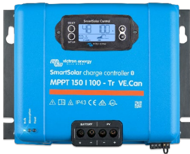
SmartSolar Charge Controller MPPT 150/100-Tr VE.Can with optional pluggable display