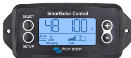
Display a spina SmartSolar

Si deve solo rimuovere il sigillo in gomma che protegge la spina sulla parte frontale del regolatore e inserire il display.